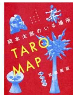
TARO MAP 首都圏版