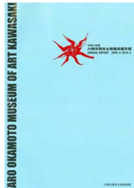
平成 21 年度 美術館年報