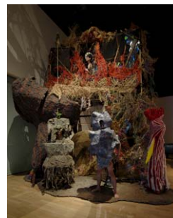
オル太 《つちくれの祠》