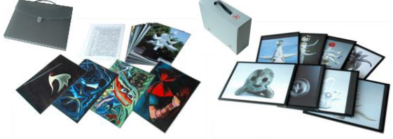
【パウチ加工 36 作品 42.5×30.0】