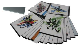
【パウチ加工 40 作品 42.5×30.0】