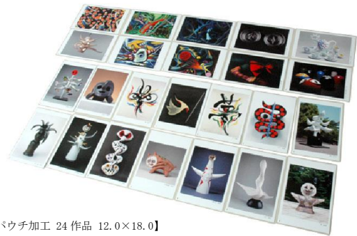
【パウチ加工 24 作品 12.0×18.0】