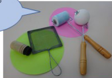
絵具セット・画用紙