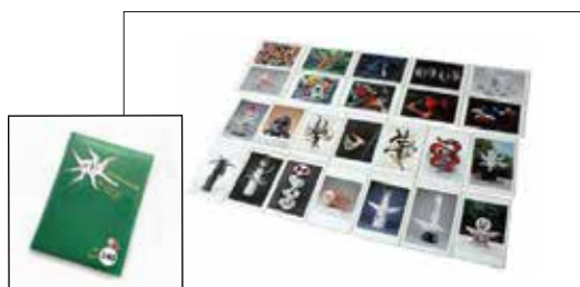
アートカード（A5 サイズ）

岡本太郎の作品と楽しくふれ合える教材を貸出しています。無料でご利用いただけます。（送料は学校負担になります）映像 DVD “岡本太郎の芸術”、A5・A3 サイズのパウチ加工した作品写真など、クラス全体での鑑賞や、グループワークに活用できます。