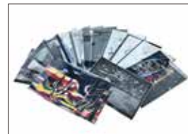
《明日の神話》セット（A3 サイズ）