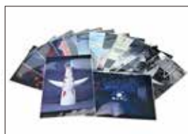
《太陽の塔》セット（A3 サイズ）